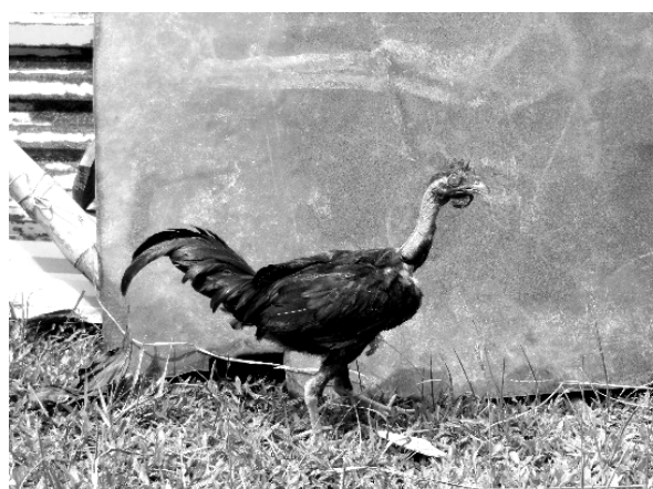
Hình 2. Gà Trụi lông cổ trống

Lúc 01 ngày tuổi, gà Trụi lông cổ có màu lông vàng nhạt, nâu vàng có đốm đen ở đầu, đuôi và đầu cánh, cổ dài và không có lông; da, mỏ và chân có màu vàng.