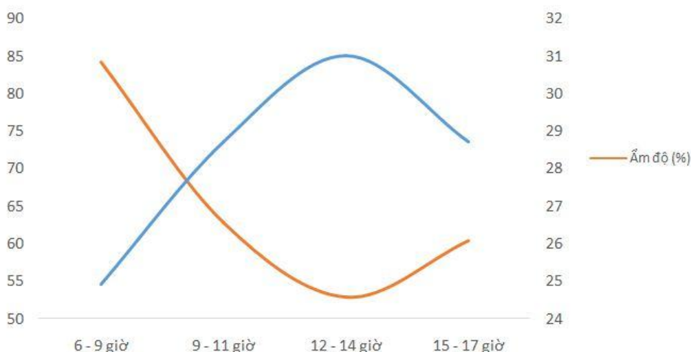
Biểu đồ 1. Nhiệt độ và ẩm độ trung bình tại ô chuồng

Tuy nhiên không có sự tương quan đáng kể giữa nhiệt độ chuồng úm và tuổi đến sự tăng trưởng của bộ xương ( P > 0,05 ) (Moraes và cs., 2002), cho nên gà con sẽ sinh trưởng tốt trong vùng nhiệt thích hợp và điều này cần được xem xét cho các nghiên cứu ảnh hưởng của điều kiện môi trường kế tiếp. Ngoài ra tác giả còn khẳng định nhiệt độ môi trường cũng ảnh hưởng lên sự tăng trưởng của tim nhất là trong tuần tuổi đầu cho nên kiểm soát nhiệt độ lồng úm vô cùng quan trọng. Moraes và cs. (2002) cũng khuyến cáo rằng hàm lượng lòng đỏ hấp thu phụ thuộc nhiệt độ tại lồng úm. Khối lượng lòng đỏ tiêu đáng kể do nhiệt độ úm trong suốt 1 đến 3 ngày tuổi đầu tiên, túi lòng đỏ chứa tương ứng 50% năng lượng tổng số và 40% protein vào cuối giai đoạn ấp, đến ngày tuổi thứ 4 tỷ lệ này giảm lần lượt là 2% và 6%. Nghiên cứu này cũng chỉ ra rằng cho gà con ăn sau khi nở 24, 48 và 72 giờ đã làm giảm khối lượng túi lòng đỏ tương tự.